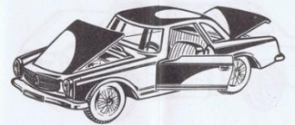
503 - Mercedes Benz 230 SL. - L. 800