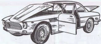
515 - Iso Rivolta Coupé GT.