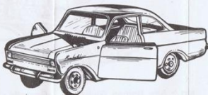
510 - Opel Kadett Coupé - L. 800