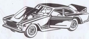
501 - Maserati 3500 GT. Coupé - L. 800