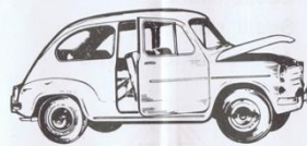
511 - Fiat 600 - L. 700