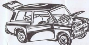
Art. 505 - Autobianchi Bianchina Panoramica - L. 800