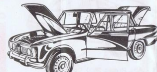
523 - Alfa Romeo Giulia T.I. Super - L. 800