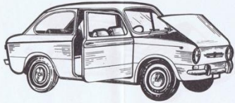
513 - Fiat 850 - L. 700