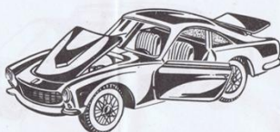
504 - Ferrari 250 GT. Berlinetta - L. 800