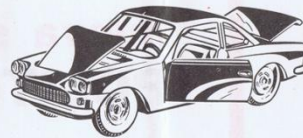
502 - Siata Coupé Fiat 1500 - L. 800