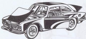
500 - Alfa Romeo Giulia Sprint GT. - L. 800