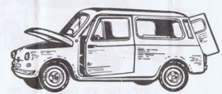
512 - Fiat 500 Giardinetta - L. 600