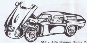
516 - Alfa Romeo Giulia Zagato - L. 800