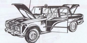
531 - Alfa Romeo Giulia T.I. «Gazzella» - L. 800