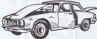
514 - Alfa Romeo 2600 Coupé GT.