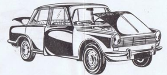
524 - Simca 1500 - L. 800