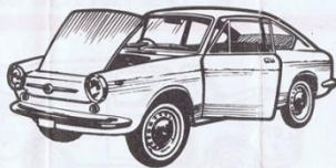
517 - Fiat 850 Coupé - L. 700